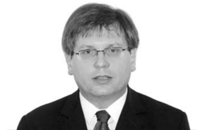
Fabiny Tamás püspök Északi Egyházkerület