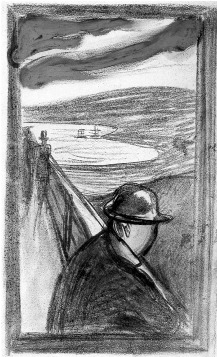
EDUARD MUNCH: KÉTSÉGBEESÉS

Légy reszketésem öröme, mint lombjai a fának: adj nevet, gyönyörű nevet, párnát a pusztulásnak.