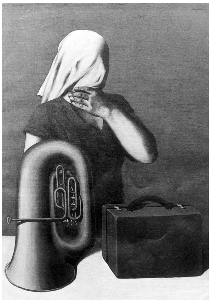
RENÉ MAGRITTE: HISTOIRE CENTRALE